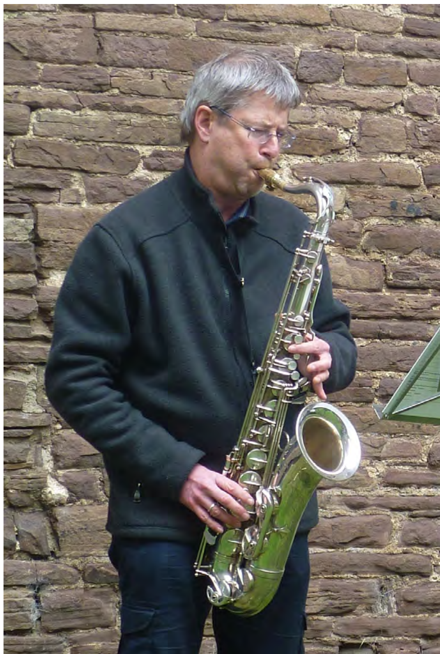
25.5.2017, Christi Himmelfahrt